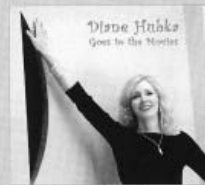
「ザ・ルック・オブ・ラブ/ダイアン・ハブカ (VSOJAZZSSJ)」

実は年内に来日の予定という。嬉しいではありませんか。早く麗しきご尊顔を拝したい。